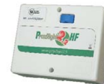
2 Portes en HF (radio) ou 1 porte HF et 1 porte résident