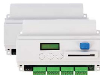
Centrales Multi-ports LE/IP_GSM