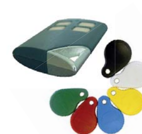
Badges de couleur et télécommande radio