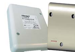
2 Portes en HF (radio)