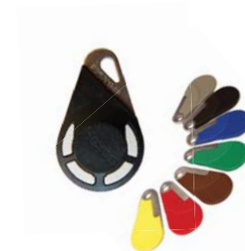
Badges de couleur et télécommande radio